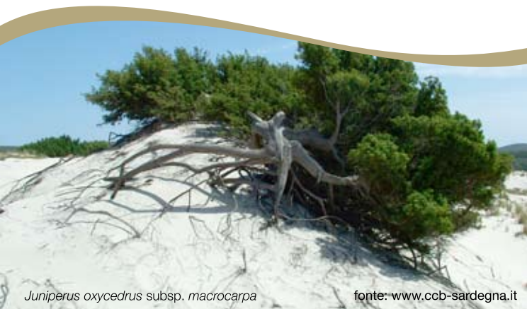
Juniperus oxycedrus subsp. macrocarpa

sono accumuli di sedimento che si formano sui litorali in seguito all'azione prevalente dei venti, spesso combinata con l'azione delle onde di tempesta dal mare e con gli eventi alluvionali da terra. I sedimenti provenienti dalla spiaggia o da corsi d'acqua limitrofi possono essere trasportati dal vento e accumulati nel retro spiaggia, formando depositi, chiamati campi dunali, le cui dimensioni possono variare da pochi metri a diversi chilometri quadrati, raggiungendo in alcuni casi altezze di oltre dieci metri. Questi ecosistemi, poveri di nutrienti e sferzati da venti salmastri, vengono comunque popolati da specie vegetali (alcune delle quali rare o a rischio di estinzione) che tendono a disporsi in fasce parallele alla riva. Dopo una prima fascia in cui la vegetazione è assente, incontriamo le specie pioniere annuali, come la Cakile maritima . Via via che ci si allontana dalla riva, compaiono altri tipi di vegetazione erbacea perenne, che contribuiscono a stabilizzare la duna. Sulle dune maggiormente consolidate si instaura una vegetazione costituita da boscaglie in cui predomina il ginepro coccolone ( Juniperus oxycedrus subsp. macrocarpa ) Dal momento in cui la duna si forma (spesso a partire dai resti spiaggiati di Posidonia oceanica e altro materiale organico) e per tutta la sua esistenza, le piante marine e terrestri svolgono un ruolo fondamentale per la sua conservazione.